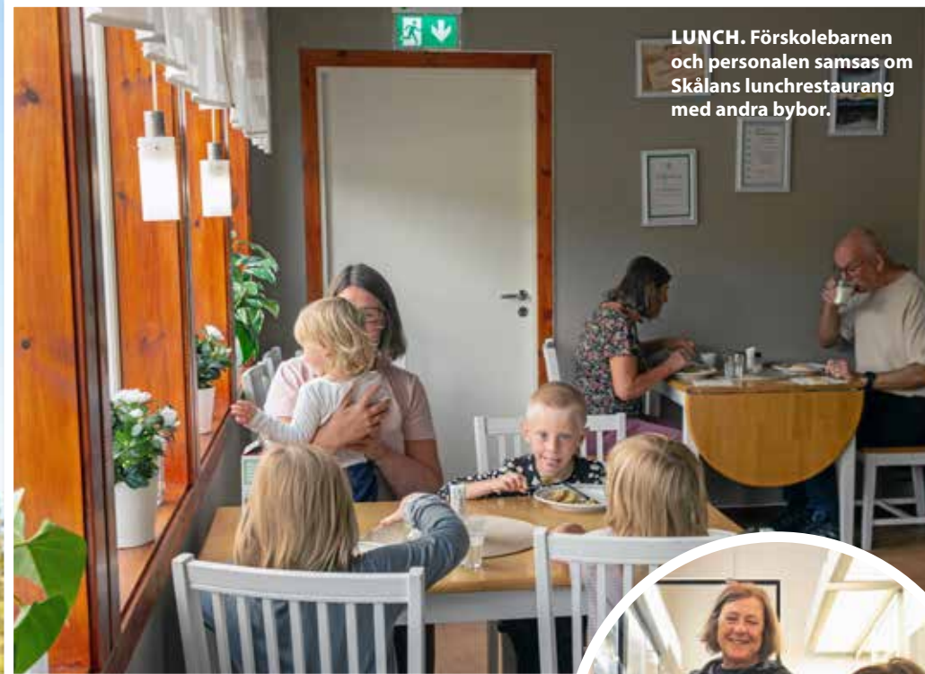
LUNCH. Förskolebarnen och personalen samsas om Skålans lunchrestaurang med andra bybor.